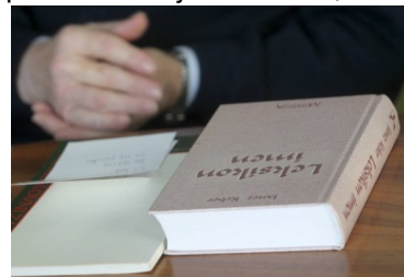
Imena podeljujemo, priimke podedujemo.

Glavnina priimkov se je oblikovala iz štirih vrst poimenovanj. Na prvem mestu so osebna imena, navadno očetovo ime, ki je bilo s končnicami jezikovno preoblikovano v izočetni priimek. »Če je oče Peter,«