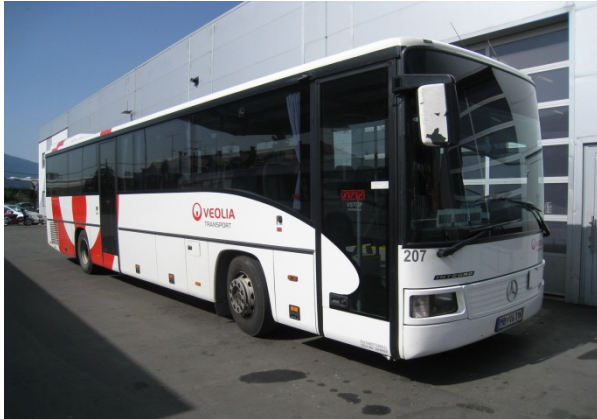
FREE PUBLIC TRANSPORT