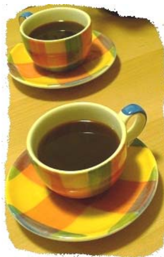
CHATTING OVER COFFEE