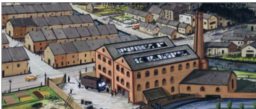
Industrijska mestna četrt v Angliji leta 1950