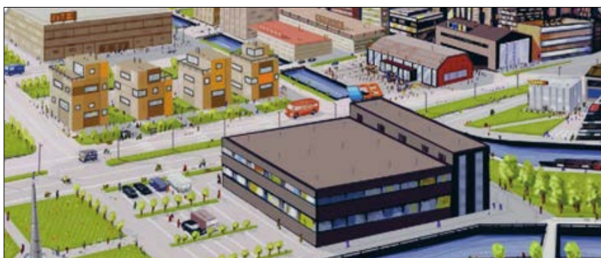
Industrijska mestna četrt v Angliji leta 2020