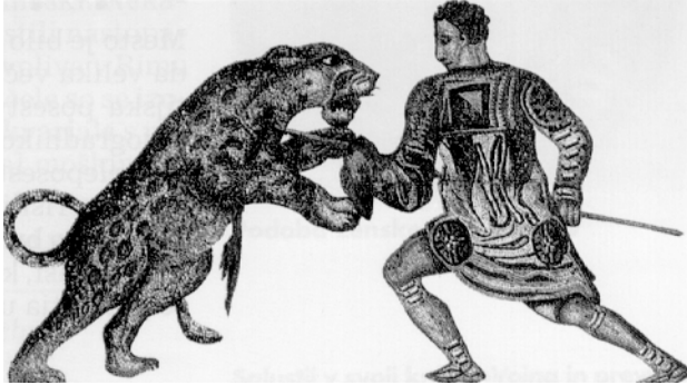
Slika 1: Gladiator