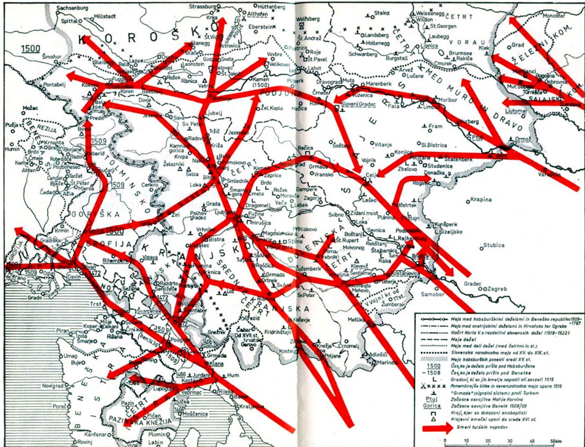
Karta 1: Smeri turških vpadov

(Vir: Simoniti, V., 1990: Turki so v deželi že, str. 85. Mohorjeva družba. Celje)