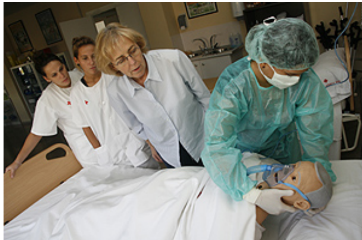
Alumnas del ciclo formativo de Técnico en Atención Sociosanitaria.