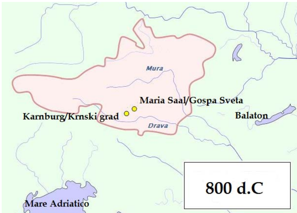
Figura 1: Carta politica del 800 d.C.

(Fonte: http://upload.wikimedia.org/wikipedia/commons/9/9e/Carantania_800_AD.PNG ) (Consultato il 23. 2. 2013)