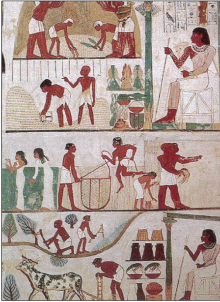
Slika 1: Kmečka opravila

3. Kmetje so v Egiptu predstavljali najštevilnejši sloj prebivalstva.