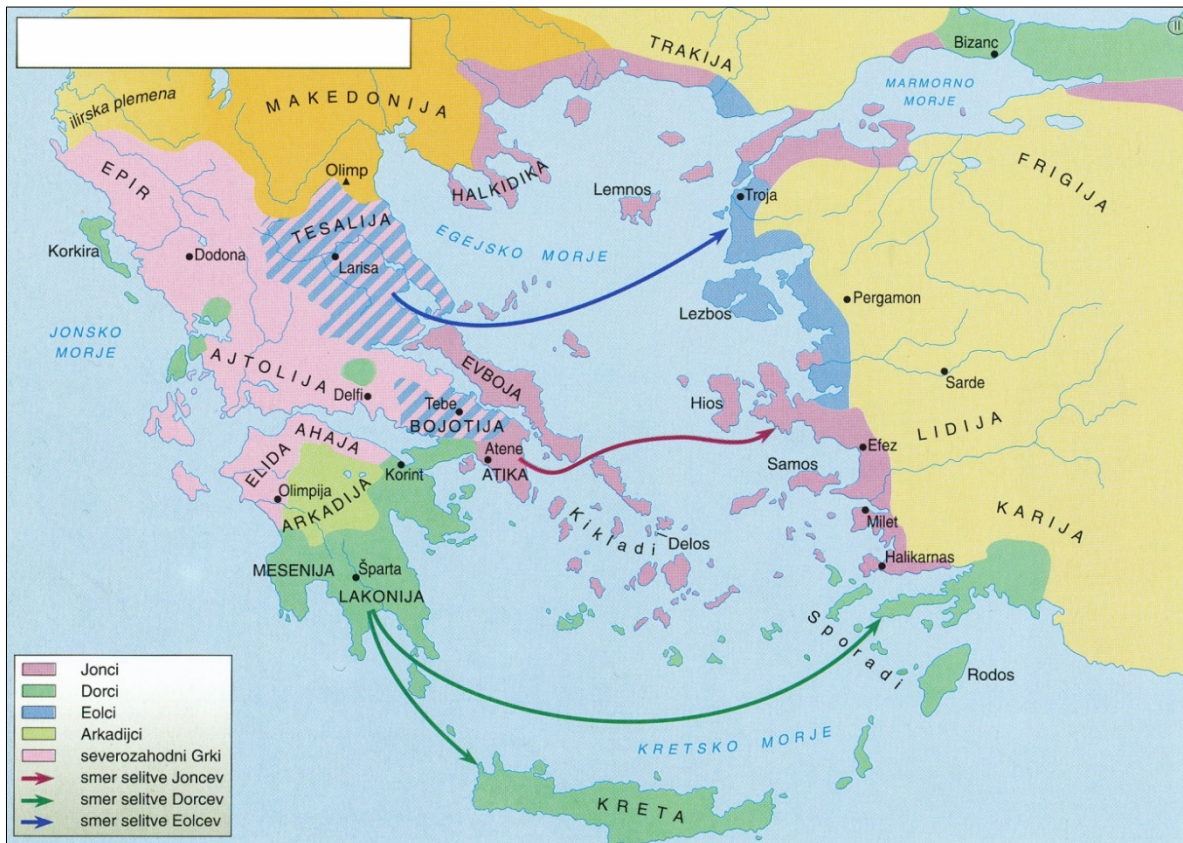
Slika 3: Poselitev Grčije po letu 1200 pr. n. Kr.