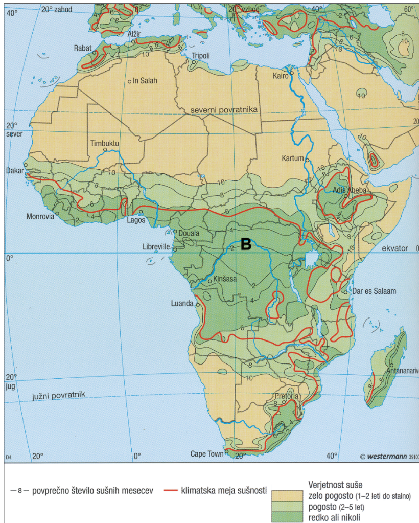
Slika 11: Število sušnih mesecev, verjetnost suše

(Prirejeno po: Atlas sveta za osnovne in srednje šole, str. 120. Mladinska knjiga. Ljubljana, 2018)