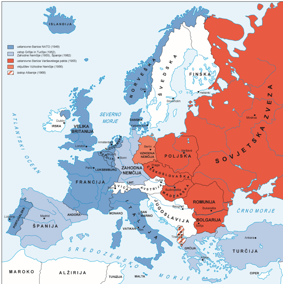
Slika 13: Evropa v hladni vojni

V sivo polje ne pišite. V sivo polje ne pišite. V sivo polje ne pišite. V sivo polje ne pišite. V sivo polje ne pišite.