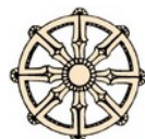
Figura 2: Simboli