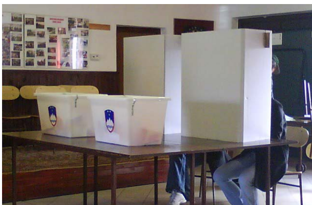
Figura 1: Seggio elettorale

Basandoti sulla figura 1, indica una regola prevista nelle procedure elettorali democratiche e applicata nel seggio.