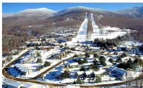
Smuggler's Notch Resort