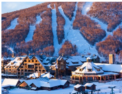
Stowe Mountain Resort