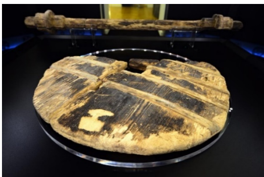
Slika 1: Barjansko leseno kolo z osjo

Beseda kolo ima v slovenščini več pomenov. V tem besedilu se uporablja večinoma v pomenu ploščata priprava okrogle oblike, ki omogoča premikanje vozila.