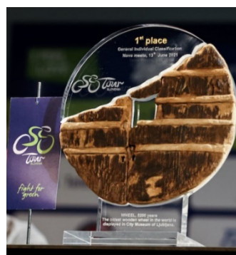
Slika 2: Pokal za najboljše tri kolesarje na dirki Po Sloveniji