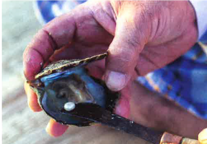
Slika: Biser v školjki