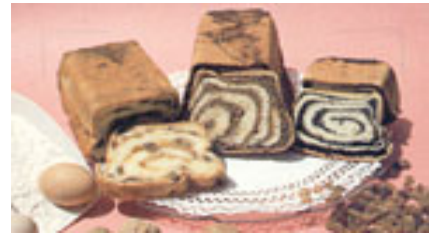
Slovenian cake, POTICA