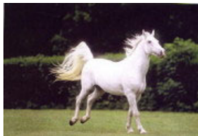
Slovenian horse breed, LIPICANEC