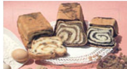
Slovenian cake, POTICA