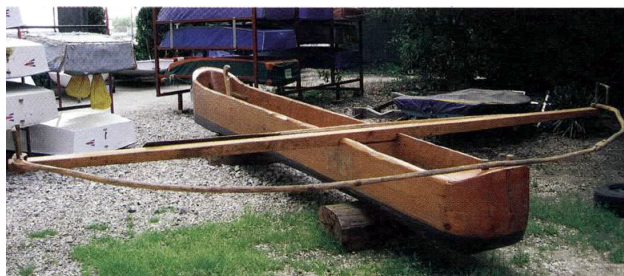
Na novo stesana čupa, ki jo hranijo v slovenskem jadralskem klubu Čupa v Sosljanskem zalivu.

širino pa le kakšnih 70 centimetrov. Bile so torej dolge in ozke ter zato izredno hitre. Ribičem je težave povzročala le slaba bočna stabilnost čup. Iznajdljivo so jo izboljšali z dolgimi vesli (tudi do šest metrov), oprtimi v prečni drog.