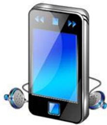
1. MP3 PLAYER