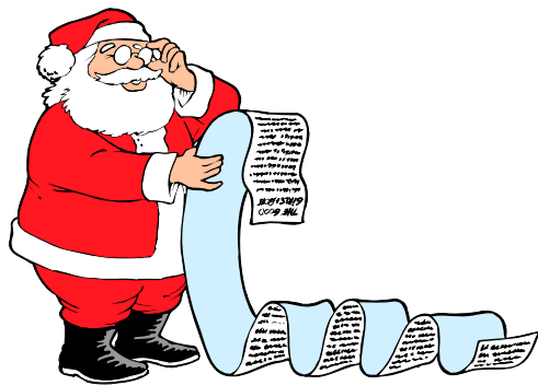
1. Santa Claus