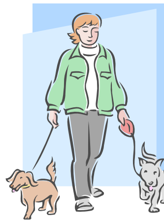
2. dog walker