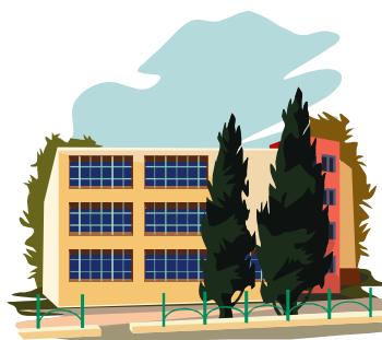
2. grammar school (gimnazija)