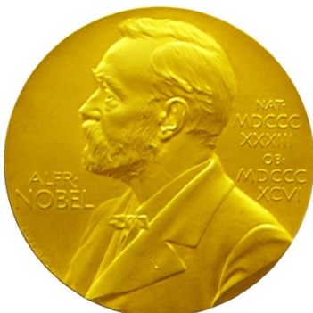
1. NOBEL PEACE PRIZE