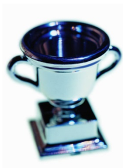
3. BEST SMALL-SIZE ENTERPRISE AWARD