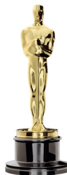
2. OSCAR FOR BEST ACTOR / ACTRESS