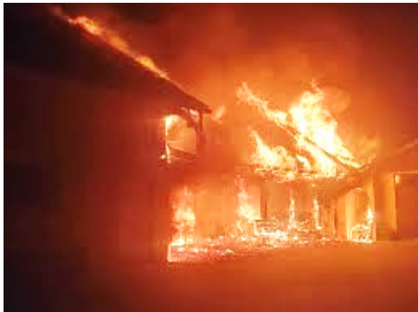
Slika 4: Požar na stanovanjski stavbi

Požari na objektih spadajo med najnevarnejše vrste požara. Največ požarov je na stanovanjskih stavbah. Večina takšnih požarov se pogasi z vodo.