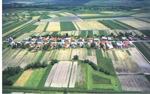
Slika 2 / 2. sz. kép