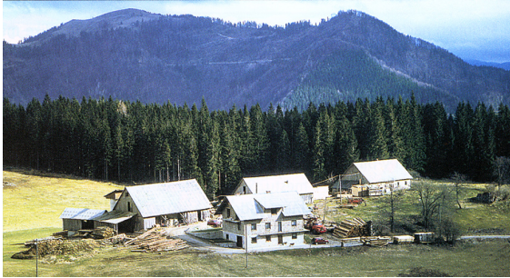
Slika 1 / 1. sz. kép