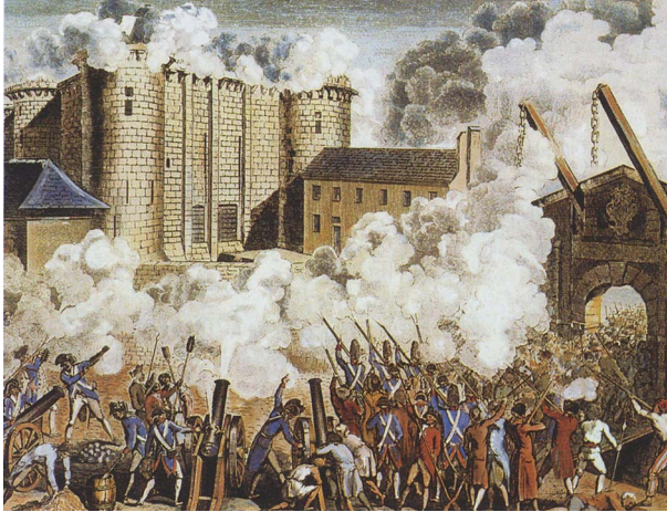
Slika 4: Napad na Bastiljo