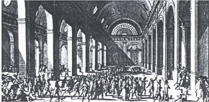
Slika 5: Odgon žirondistov na usmrnitev