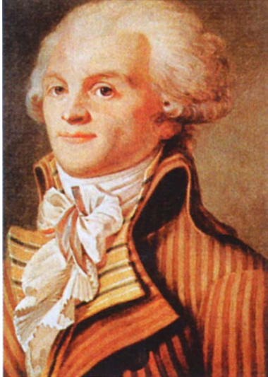
(Vir: Hozjan, A., Potočnik, D., 2000: Zgodovina 2, str. 308. DZS. Ljubljana)