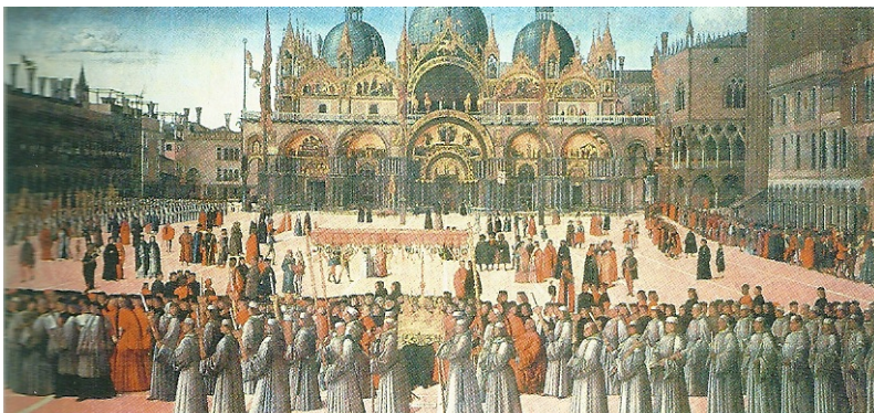
Slika 1: Trg sv. Marka s katedralo in doževo palačo

19. V srednjem veku je prišlo do velikega vzpona Benetk iz mestne države v regionalno silo.