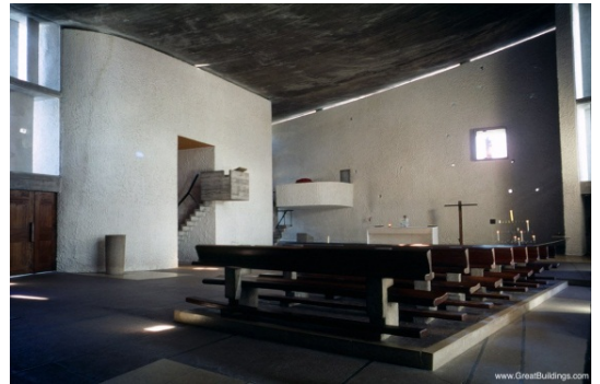
Slika 17 b