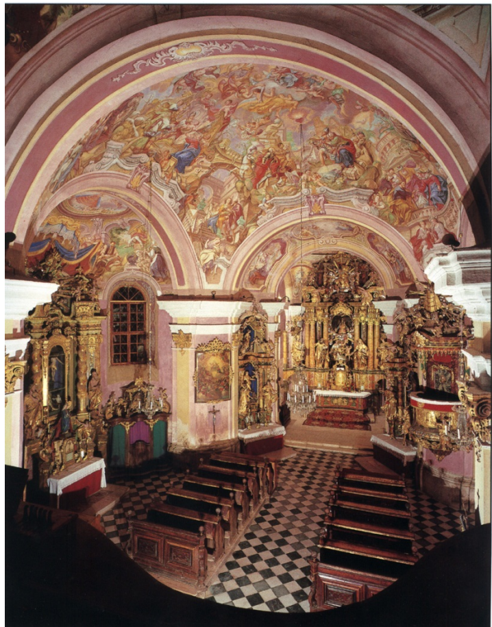
Slika 2 a

(Vir slik 2 in 2 a: N. Šumi idr., Po poti baročnih spomenikov Slovenije, Zavod Republike Slovenije za varstvo naravne in kulturne dediščine, Ljubljana, 1992)