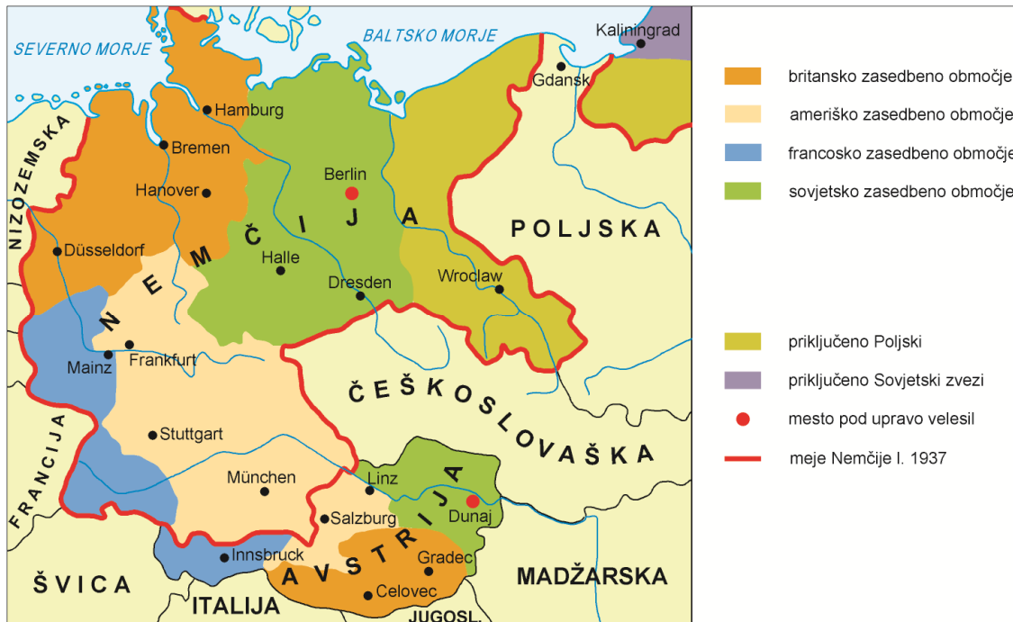
Slika 12 / 12. sz. kép: Zasedbene cone v Nemčiji in Avstriji (1945–1949)

(Vir: Gabrič, A., Režek, M., 2011: Zgodovina 4, str. 87. DZS. Ljubljana)