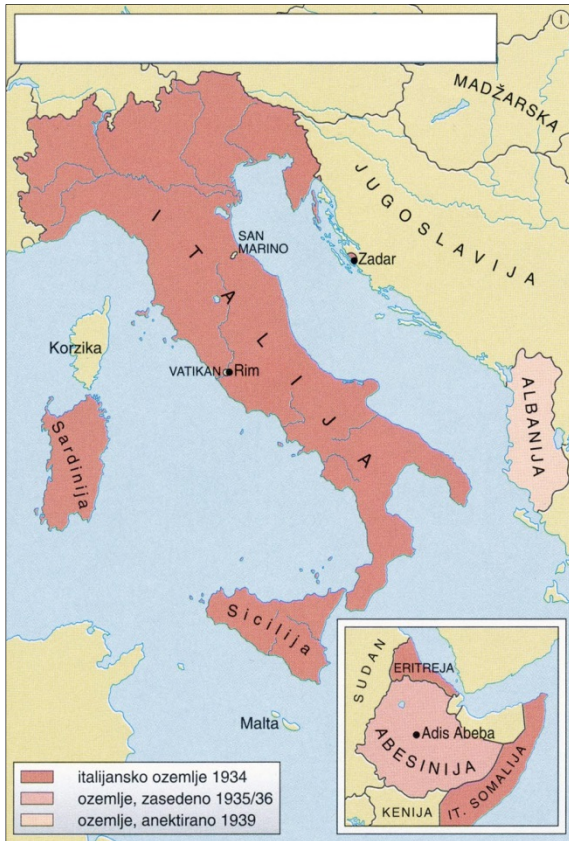
Slika 8 / 8. sz. kép: Italijanske zasedbe ozemelj v letih 1930–1940

(Vir: Mali zgodovinski atlas, str. 69. Modrijan. Ljubljana, 2010)