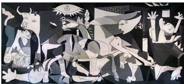
Slika 3 / 3. sz. kép

(Vir: Vodopivec, P.: O Orwellovem »premišljevanju« o Španiji. V: Orwell, G., 2009: Poklon Kataloniji, str. 234. Modrijan. Ljubljana)