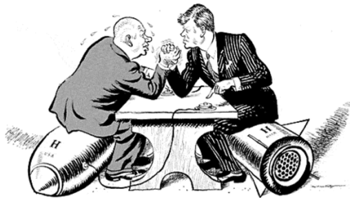
Slika 7 / 7. sz. kép

22. V začetku sedemdesetih let je prišlo do popuščanja napetosti v odnosih med velesilami. A hetvenes évek elején enyhült a feszültség a nagyhatalmak közt.