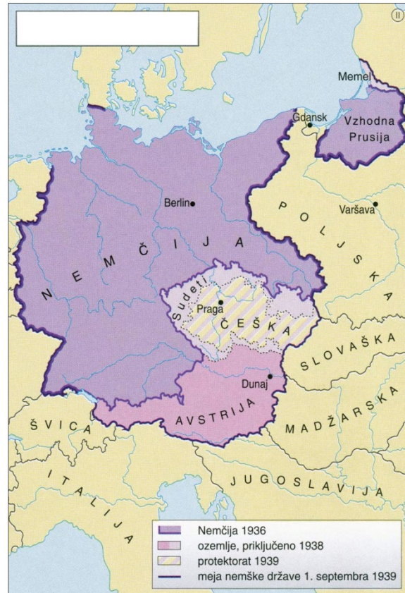
Slika 9 / 9. sz. kép: Nemčija v letih 1936–1939