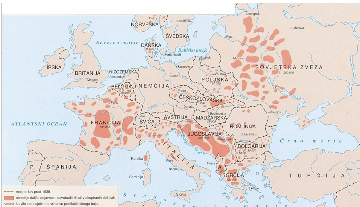
Slika 10 / 10. sz. kép: Oborožen odpor v zasedenih evropskih deželah v letih 1940–1945