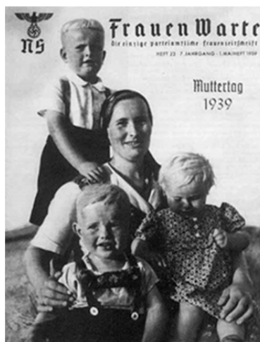
Slika 2 / 2. sz. kép: Naslovnica nemške ženske revije