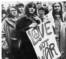
Slika 5 / 5. sz. kép

A hatvanas évek jelentősen meghatározta a háború utáni első években született ifjúságot.