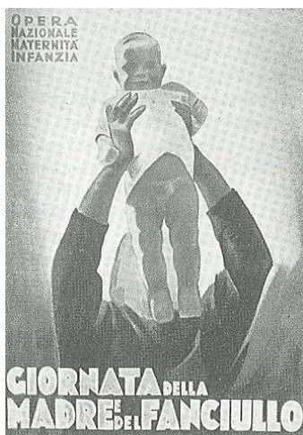
Slika 1 / 1. sz. kép: Plakat za dan mater

A két világháború közti időszakban Olaszország és Németország totalitáris diktatúrává vált. A megoldásnál vegye figyelembe a Színes melléklet 8. és 9. sz. képét!