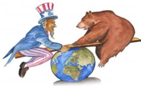
Slika 4 / 4. sz. kép

A második világháború után kialakult a keleti, illetve a nyugati tömb, kezdetét vette a hidegháború. A megoldásnál vegye figyelembe a Színes melléklet 11. sz. képét!