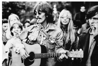
Slika 6 / 6. sz. kép