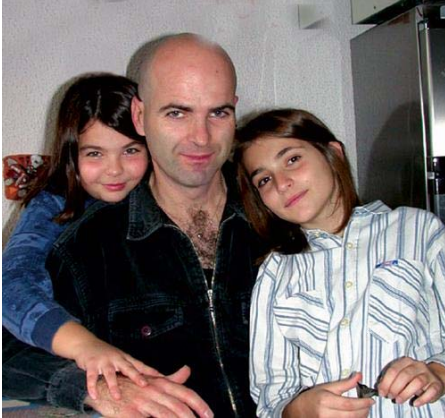
a) Slika 1