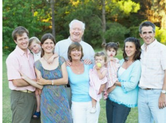
b) Slika 2