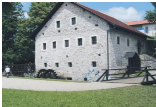
Slika: Mlin je na Trubarjevi domačiji najstarejši objekt.

Prvi Trobar na Rašici je v urbarskih zapisih omenjen l. 1482. Bil je mlinar. Priimek pa kaže, da je bil kak trobar, morda graščinski trobec, klicar, ki se je preživiljal s trobo ali trobljo. Tu, v mlinu, se je Trobarju in njegovi ženi Jeri rodil Primož. Pisalo se je leto 1508.