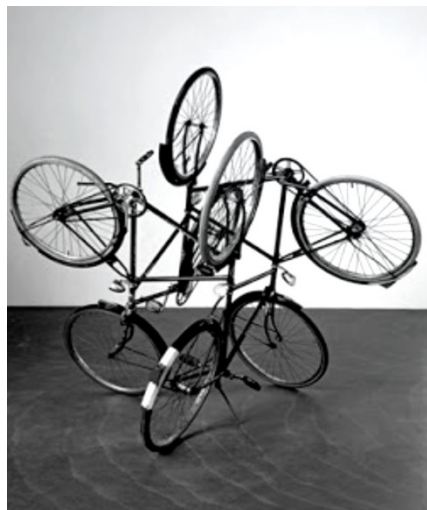
Slika 3: Gabriel Orozco: Štiri kolesa

18. Oglej si spodnjo fotografijo na sliki 3 in reši nalogo.