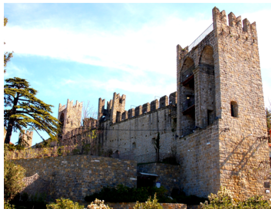
Slika 6: Piransko obzidje