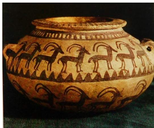
Slika 8: Vaza iz žgane gline