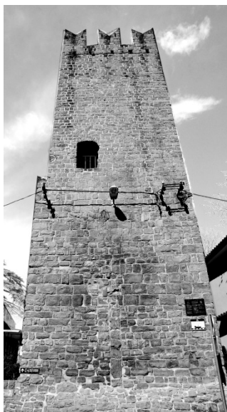
Slika 1: Piransko obzidje

9. Oglej si spodnjo fotografijo na sliki 1 in reši nalogo.