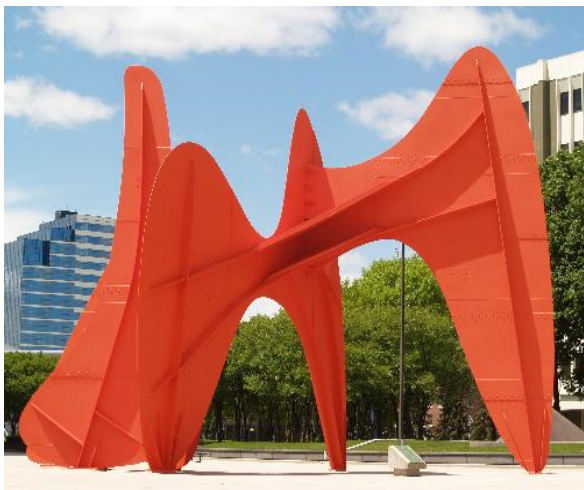
Slika 5: Alexander Calder: Velika hitrost