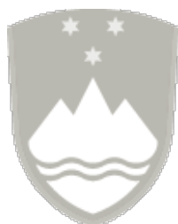
Slika 2: Grb Republike Slovenije

10. Oglej si sliko 2 in odgovori na vprašanje.