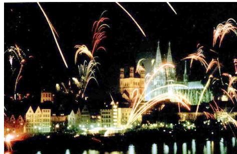
Če boste tukaj jutri, bo tudi za vas nebo razsvetlil veličastni ognjemet.

Zagotovo se je tja vredno podati med divjim in razposajenim karnevalom, ki ga po številu obiskovalcev in litrov popitega piva prekaša le še Münchenski Oktoberfest. Mesto se spremeni v pravi mali Rio de Janeiro, kjer ljudje, ki so oblečeni v domiselne in živobarvne kostume, rajajo po ulicah, veseljačijo in plešejo. Karneval bo v letu 2004 potekal od 19. do 24. februarja, vrhunec pa je tako imenovani Rosenmontag, ko se po mestu zvrstijo številne uradne in neuradne parade, spontano petje in praznovanje.