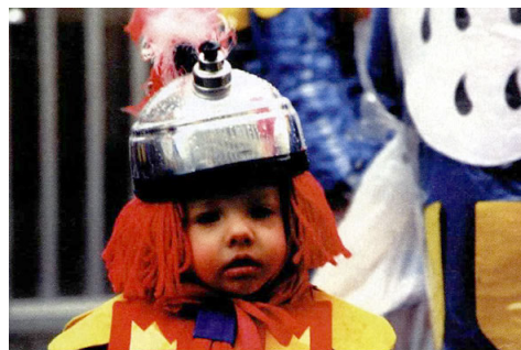
Od 19. do 24. februarja poteka karneval vseh karnevalov; pravijo, da je pomanjšani Rio de Janeiro.