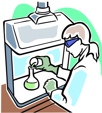
a successful scientist