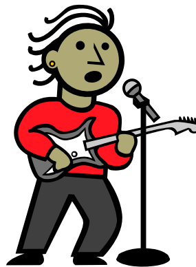
a famous musician