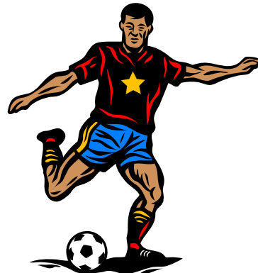
a popular footballer