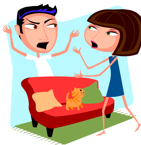
2. fighting with family members