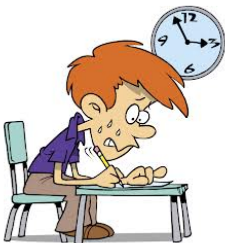
1. writing tests at school