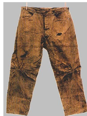
Die älteste Jeans der Welt

Die Familie fasste zunächst in New York Fuß. Wenig später erreichten Nachrichten von den ersten 3 die Ostküste. Im Jahre 1853 entschloss sich daraufhin der junge Levi, sein Glück an der US-Westküste zu suchen. Seine beiden Brüder hatte er zuvor überredet, ihm einige Vorräte Seide, Stoff und ein paar Ballen Segeltuch mitzugeben, welches er für die Präriewagen verwenden wollte, die deutsche Wagenbauer in Pennsylvania herstellten und die 4 benutzten, um den Kontinent zu überqueren. Während der Schiffsreise hatte Strauss all seine Güter bis auf die Segeltücher an Mitreisende verkauft. In San Francisco angekommen tadelte ihn ein Goldsucher, er hätte keine Hosen mitgebracht, denn diese würden während der Goldsuche sehr beansprucht und daher ständig benötigt. Strauss schneiderte kurzerhand 5 ein dem harten Beruf angemessenes Beinkleid. Das Produkt war nicht chic, aber unverwüstlich, und so wurde es ein Verkaufsschlager. Schon bald gründete er die Levi Strauss & Co. in der Battery Street. 6 waren braun und wurden mit Hosenträgern gehalten. Schon bald waren die Segeltuchvorräte aufgebraucht und Strauss musste ab 1860 neuen Stoff importieren. Dieser kam aus Nimes in Frankreich und so erhielt das Produkt 7 . Die Farbe war durch den neuen Stoff vorgegeben: indigoblau.