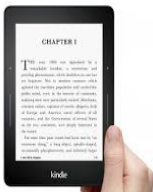
1. an e-reader