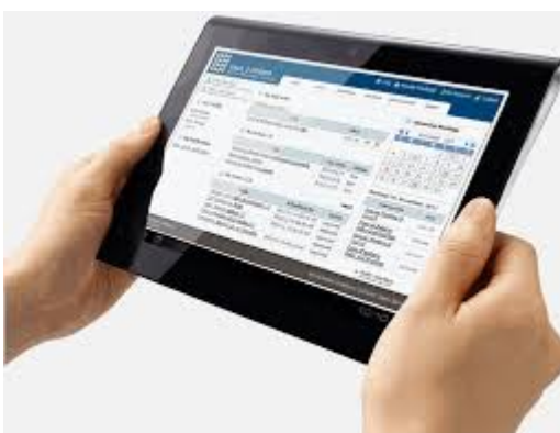
2. a tablet