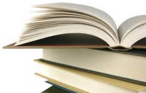
4. printed materials