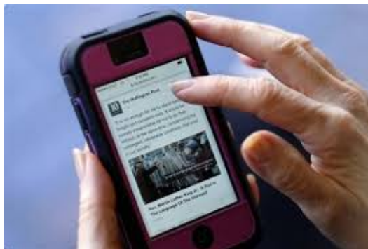
3. a mobile phone