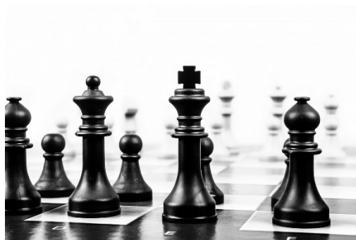
2. chess tournament