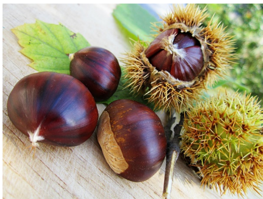
3. chestnut picnic