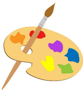
1. 'Arts for all' workshop