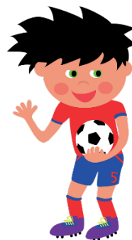
4. football tournament