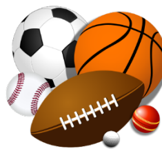
4. Team sports