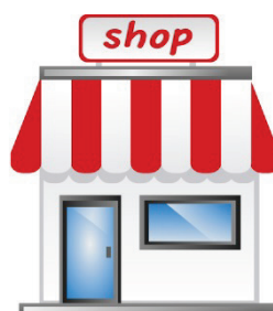
2. Going to a local shop