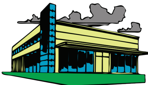
3. Going to a shopping centre