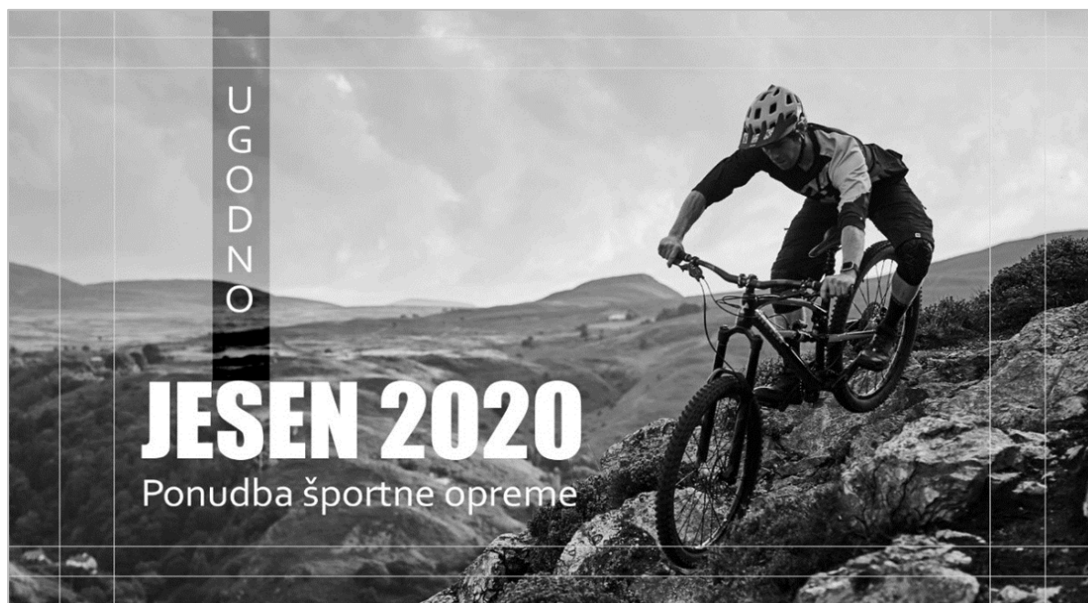
Slika 4: Najavna špica

7.4. Naročnik želi, da se na začetku TV-oglasa izpiše ime podjetja. Katero animacijsko tehniko bi uporabili za animacijo besedila, kot je prikazano na sliki 4? Opišite postopek animiranja pri tej animacijski tehniki.