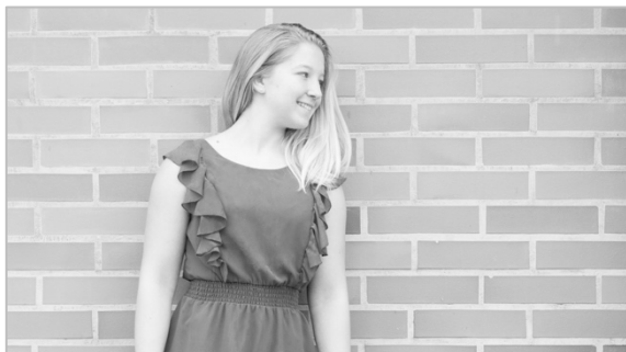
Slika 2: Izrez 1

3.1. Analizirajte izrez 1, prikazan na sliki 2.