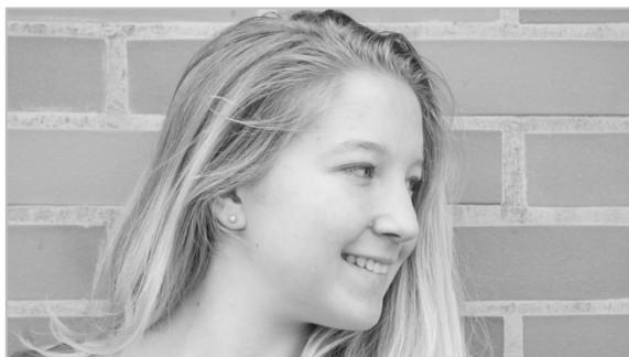
Slika 3: Izrez 2

3.2. Analizirajte izrez 2, prikazan na sliki 3.